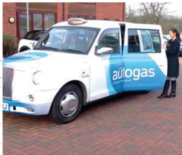
Mit einem Londoner Taxi, umgerüstet auf Autogas, macht das Shopping sicher doppelt so viel Spaß.

große Auftrag dabei herauspringen.“ Und das hieß konkret: Ein Auftrag für die Umrüstung von zirka 1.500 black cabs in Birmingham und mehr als 20.000 in London.